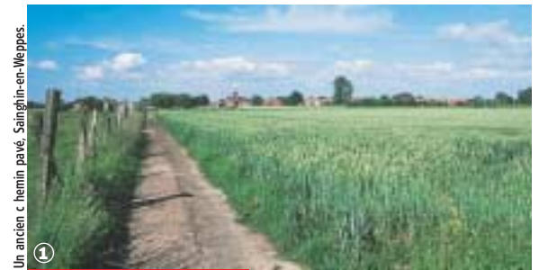
Un ancien chemin pavé, Sainghin-en-Weppes.

Randonnée Pédestre Un siècle d'histoire à Sainghin-en-Weppes : 3,5 km ou 11 km