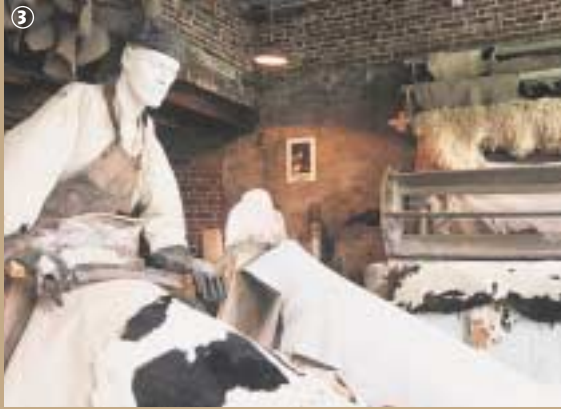
Tannerie Nory, Sainghin-en-Weppes.

principalement à fabriquer des capotes de voiture et des harnais mais aussi des courroies et des taquets de filature en cuir pour l'industrie textile. L'élaboration d'un cuir à semelle très résistant, qui intéressa l'armée, permit à l'entreprise d'éviter la crise des années 1930. Dans les années 1950, l'atelier Nory se tourne vers